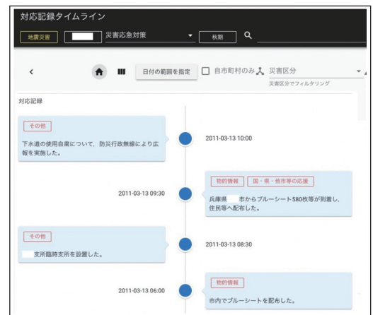
図2：災害情報可視化機能